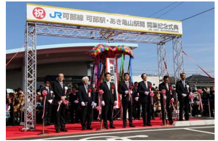
H29.3.4 可部線電化延伸開業